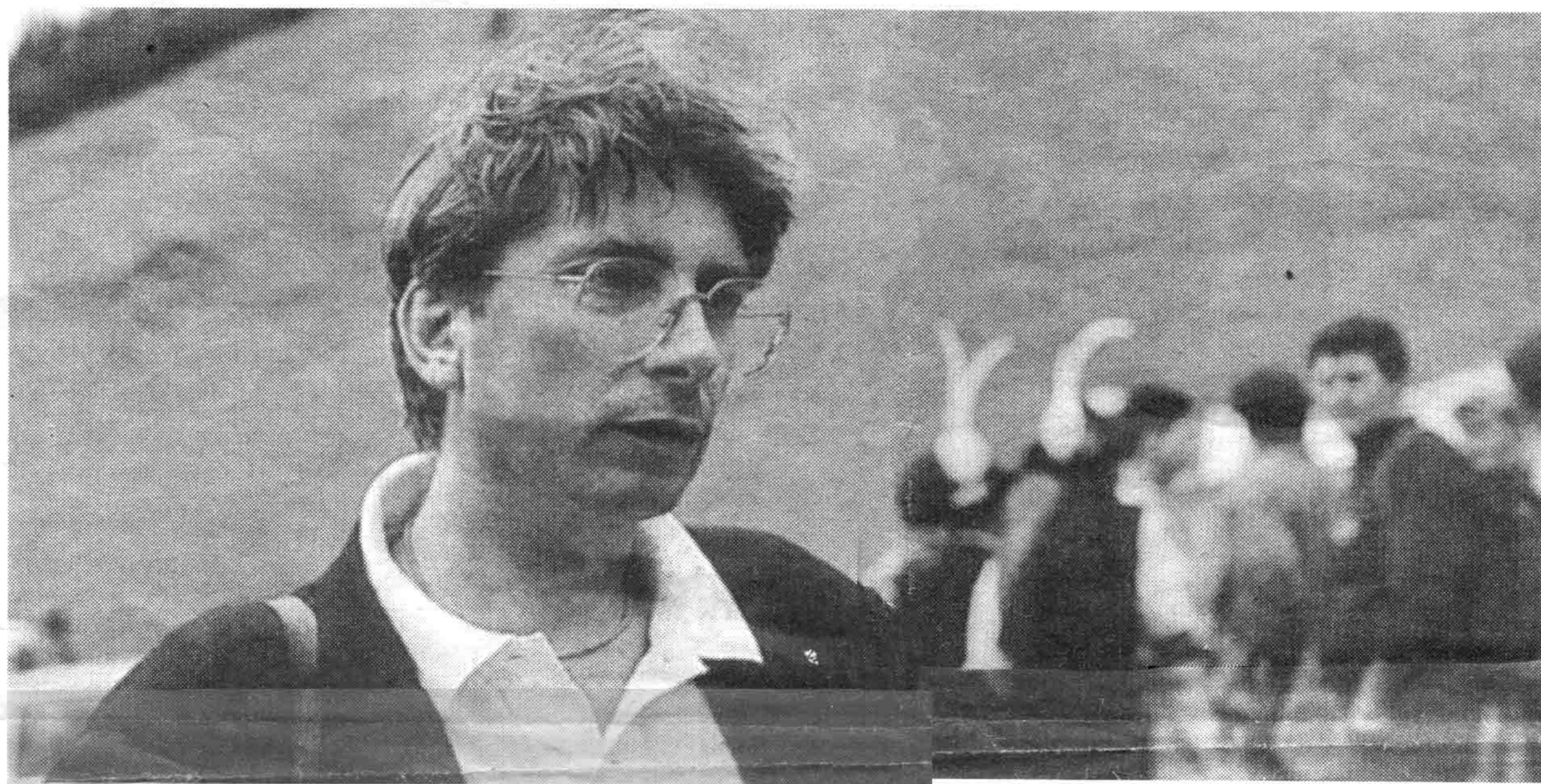
Alexander Langer il fondatore dei verdi che si tosse la vita il 3 luglio del 1995 il 24 aprile il nuovo teatro di Bolzano ospiterà la prima dello spettacolo che ne racconta la vita

E nella sua prefazione al libriccino che il Teatro metterà a disposizione degli spettatori, il sindaco accentua ancor