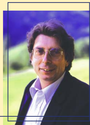
Alexander Langer, fondatore dei Verdi italiani, è stato il primo euro-parlamentare verde eletto, per due volte, nella Circostrizione Nord-Est (nell'89 e nel '94).

L'Europa gioca un ruolo importante nella lotta alla criminalità internazionale. Tuttavia, il rafforzamento della cooperazione tra le polizie e tra i tribunali non deve avvenire a scapito dei diritti civili. I Verdi chiedono giu-